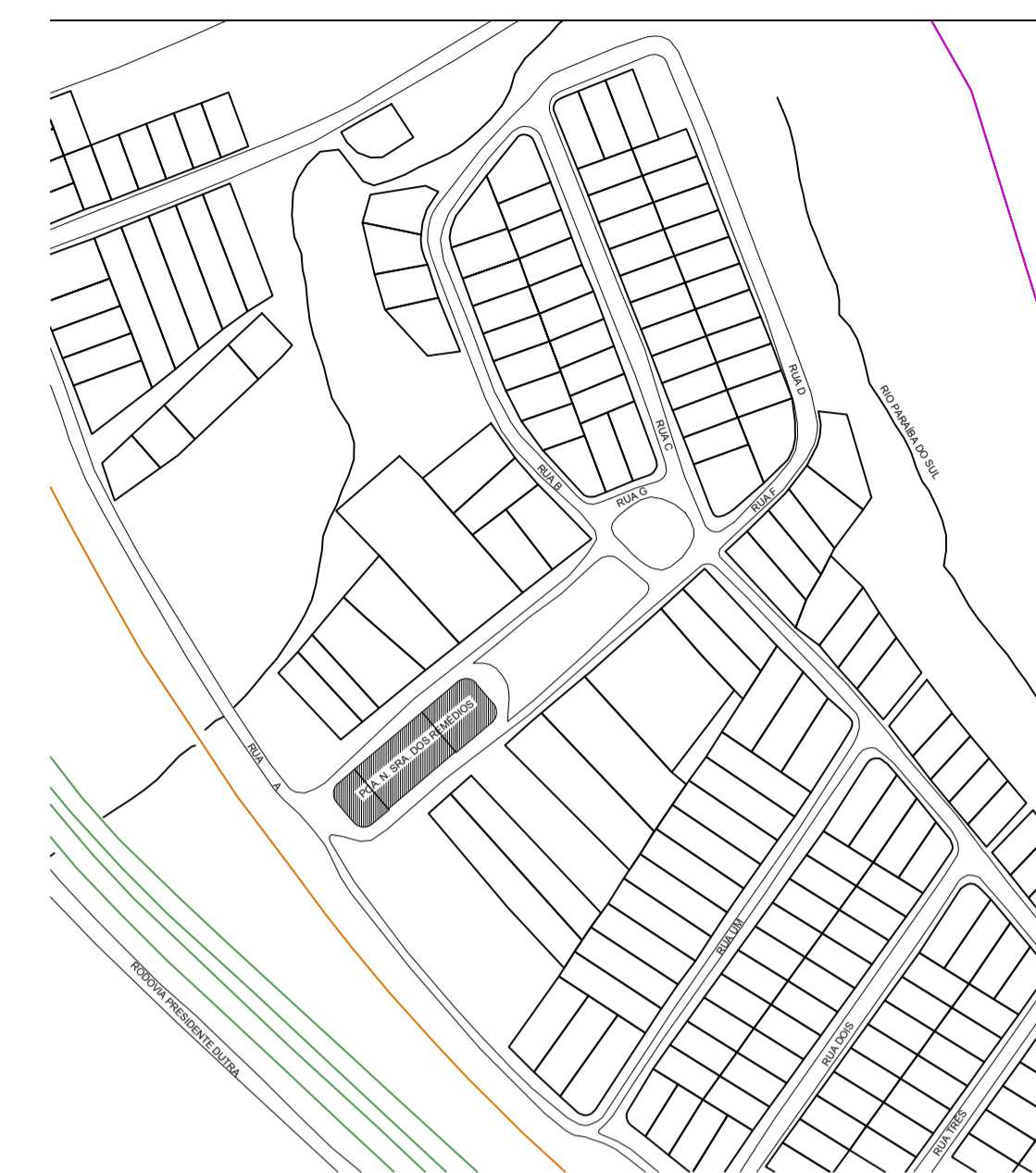
3 LOCALIZAÇÃO SEM ESCALA